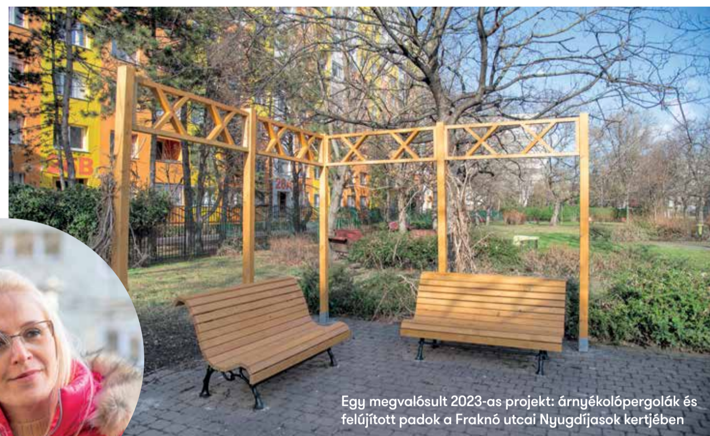
Egy megvalósult 2023-as projekt: árnyékolópergolak és felújított padok a Fraknó utcai Nyugdíjasok kertjében

A lakosság rendszeresen jelzi a képviselőknek, a polgármesternek vagy az önkormányzatnak, ki mit szeretne a háza táján. Természetesen, hogy mindenki a saját mikro-környezetét figyeli jobban, ahol sétál, sportol, unokájával, gyerekekkel tölti az idejét. Ezekből a jelzésekből az is kitűnik, hogy ami valakinek jó, az másnak nem feltétlenül az. Például valaki nagyon szeretett volna a környékére egy padot. Mikor kihelyeztük, többen kifejezték nemtetszésüket, és kérték, vigyük arrébb, mert oda járnak esténként a fiatalok iszogatni, hangoskodni. Végül leszereltük. Ez nem közösségi döntés volt, hanem néhány ember kérése alapján történt meg. A közösségi költségvetés során ezzel szemben a lakók körzetenként küldik be ötleteiket. A szakértőink megvizsgálják, hogy a beküldött igény önkormányzati területet érint-e, saját hatáskörben jogunk van-e kivitelezni és befér-e a keretbe. Ezután az első hat megvalósítható projekteket szavazásra bocsátjuk, erről is a lakók döntenek. Tehát ezek a beruházások – szemben az egyénileg beküldött igényekkel – erős lakossági támogatással érkeznek. Ráadásul a folyamatban való részvétel közösségi élményt jelent, egy győzelemig vitt projekt pedig megmutatja a közösség erejét. Azt üzeni, ha el akarsz